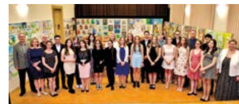
Absolventi hudebního, výtvarného a tanečního oboru ZUŠ se svými pedagogy