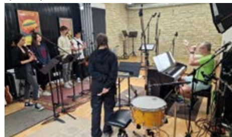
Týmová práce v nahrávacím studiu