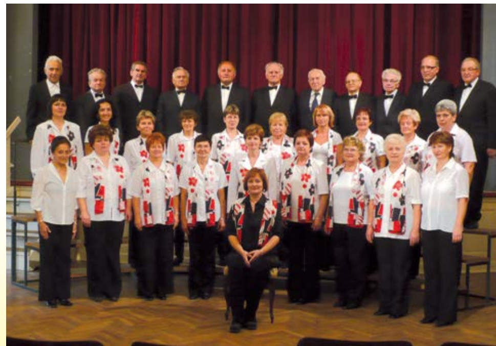
Archivní snímek Smíšeného pěveckého sboru Sušil.