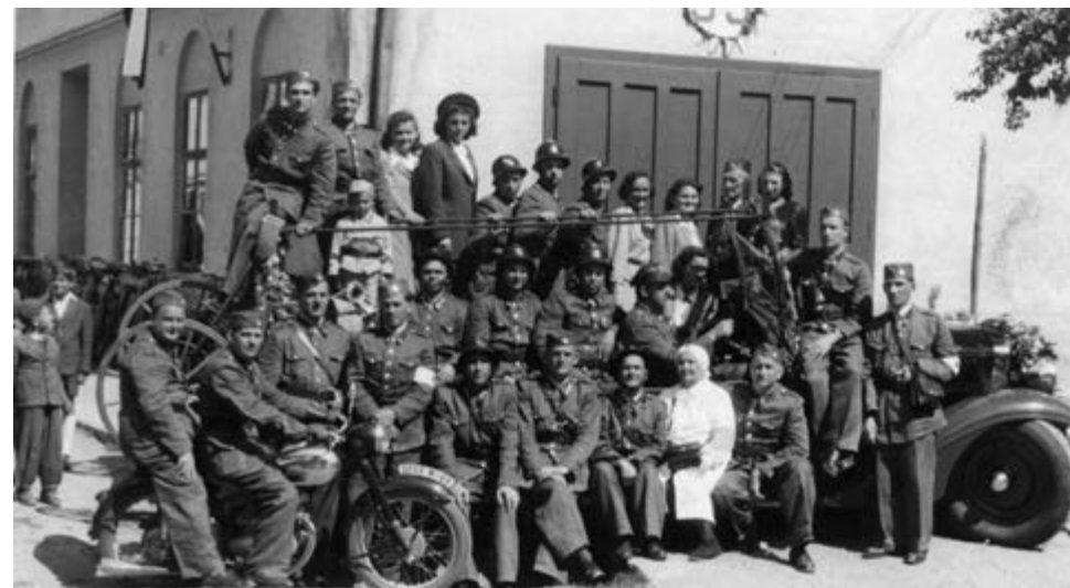
23. května 1948 před budovou nynějšího MěÚ – 55. výročí sboru a svěcení nové autostříkačky Tatra 70

Za druhé světové války proběhla reorganizace hasičstva. Hasiči zastávali v době okupace důležitou úlohu v případě vzdušného napadení.