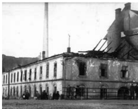
Firma Tusculum po požáru 30. listopadu 1930

V 50. letech byl prováděn soustavný nábor nových členů a v témže roce bylo započato s výstavbou nové garáže pro požární vozidlo v budově městského úřadu, v prostorách nynějších kancelářů stavebního úřadu. Byl také pořízen nový požární vůz Tatra 805 s kompletní výzbrojí. V 60. letech byly zvyšovány nároky na požární vybavení a technika byla nahrazována cisternovými vozy. Vůz Tatra 111 sloužil až do roku 1981, kdy byl nahrazen cisternovou automobilovou stříkačkou 25 ŠKODA 706 a novým dopravním automobilem DA 12 AVIA 30.auta byla garážována na různých místech. Kromě garáže na městském úřadě byla i ve skladu UP závodů v bývalém kině. V roce 1983 tento sklad vyhořel a objekt byl zcela zničen. Proto bylo v roce 1985 přistoupeno k výstavbě nových garáží, které byly od základů vybudovány svépomocí jako přístavba městského úřadu. Obě garáže využívá jednotka do současnosti.