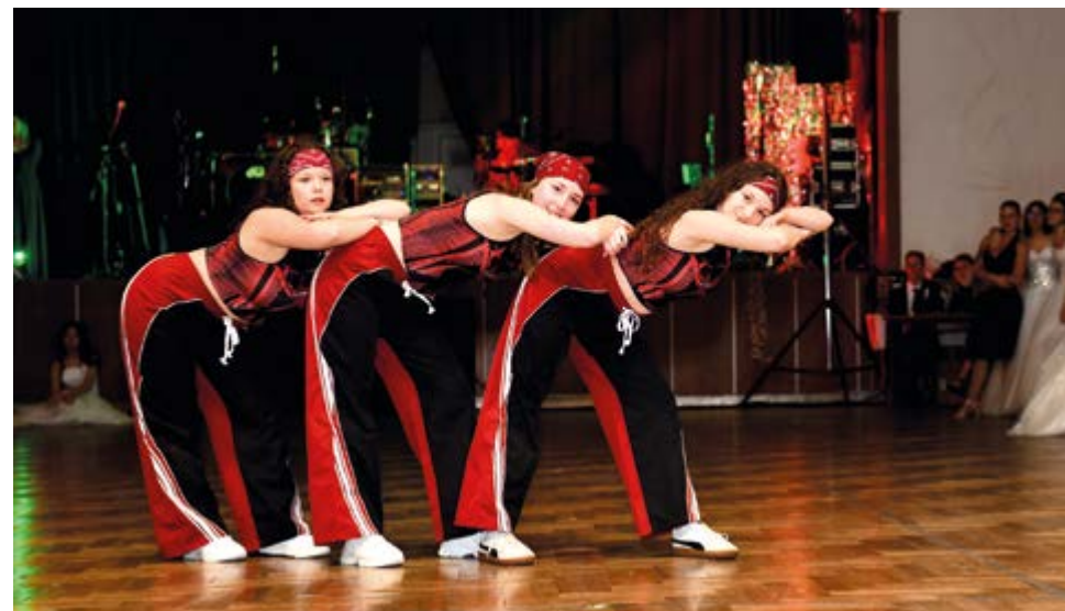
Tanečnice na polonéze ve Slavíkovcích