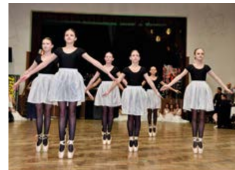
Tanečnice na polonéze ve Slavíkovcích