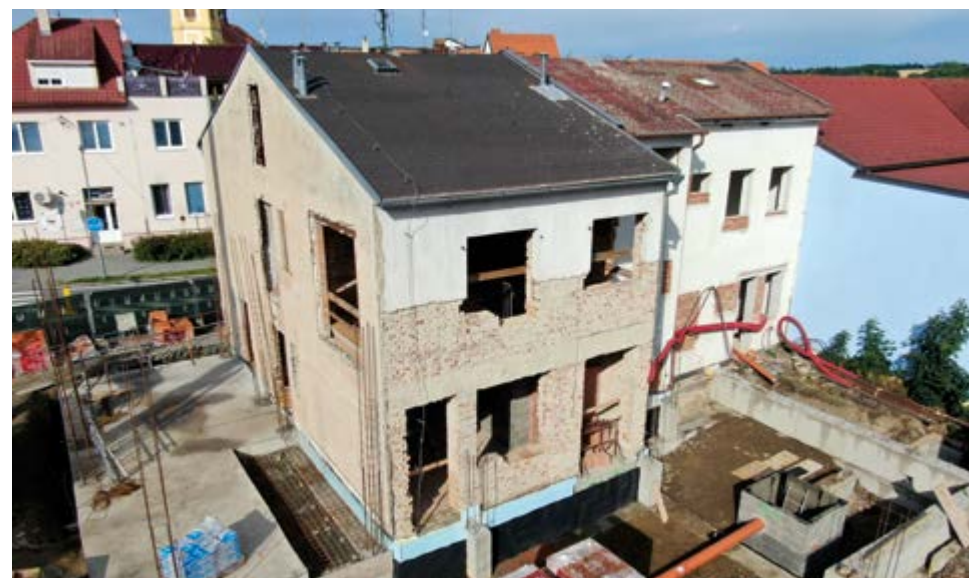
Pohled z dronu na nově budovanou hasičku

velitel Jednotky sboru dobrovolných hasičů