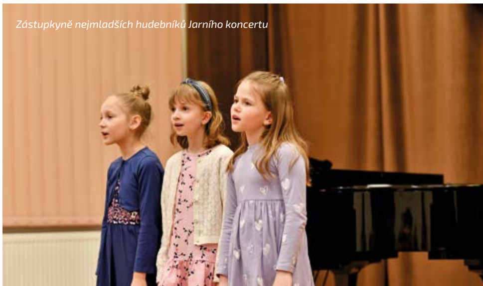
Zástupkyně nejmladších hudebníků Jarního koncertu

Exemplárním dokladem výše řečeného byl březnový Jarní koncert, který svou podstatou jaro náležitě oslavoval, ale tematickou dramaturgií i transparentně a důstojně vítal. Tradiční akce hudebního oboru nabídla početnému publiku hudbu instrumentální i vokální. Ta v hojně míře akcentovala jarní momenty a nálady. Představili se tentokrát jak žáci nejmladší, tak i ti nejstarší. Program byl hudební přehlídkou skladeb sólových i komorních. Všem aktérům se na pódiu dařilo předvést své umělecké maximum, za což byli všichni po zásluze odměněni dlouhými a hlasitými potlesky. U nejmladších muzikantů bylo pozoruhodné a dojemné vnímat, co vše se již ve svém věku naučili. Při interpretacích žáků nejstarších se ucho i oko posluchače s obdivem