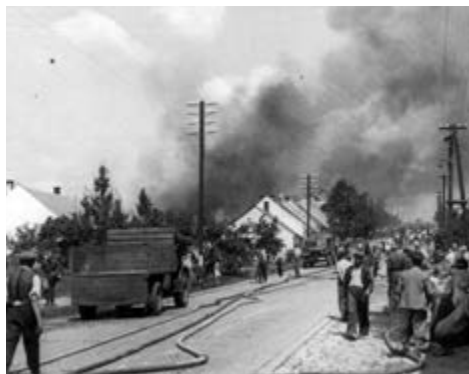
Požár firmy Skarytka 11. srpna 1947

V roce 1997 došlo k legislativním změnám v požární ochraně a na základě zřizovací listiny byla od 1. ledna 1997 zřízena Jednotka sboru dobrovolných hasičů města Rousínova (dále jen JSDH). Jednotka není součástí žádného sdružení ani sboru a je plně financována z rozpočtu města Rousínova. Je součástí Integrovaného záchranného systému Jihomoravského kraje. Hasiči města Rousínova jsou zařazeni do kategorie požárních jednotek JPO – III/1, což znamená, že zabezpečují výjezd požárního družstva do 10 minut od vyhlášení poplachu nepřetržitě 365 dní v roce. Jednotka zasahuje ve svém hasebnímu obvodu, což je Rousínov a místní části. Na základě poplachového plánu je jednotka povolávána i v rámci celého okresu Vyškov a může být povolána v případě mimořádných událostí po celém Jihomoravském kraji nebo v rámci odřadů po celé ČR. Jednotka zasahovala např. při povodních v roce 1997 na jižní Moravě, v roce 2013 v severních Čechách, v roce 2021 na Hodonínsku po tornádu a v roce 2024 při povodních v Jeseníkách. JSDH je v dnešní době vybavena dostatečnou technikou, osobní výzbrojí a výstrojí a je schopna zasáhnout u většiny mimořádných událostí. V současné době jednotka disponuje třemi zásahovými vozidly (CAS 20 TATRA 815, CAS 20 DENNIS RAPIER, dopravní automobil FORD TRANZIT). Současná činnost není jen zásahová. Členové jednotky se zúčastňují pravidelného školení,