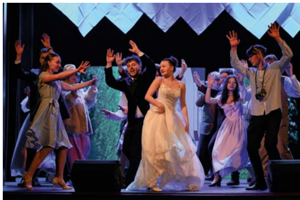
Premiéra Velký den