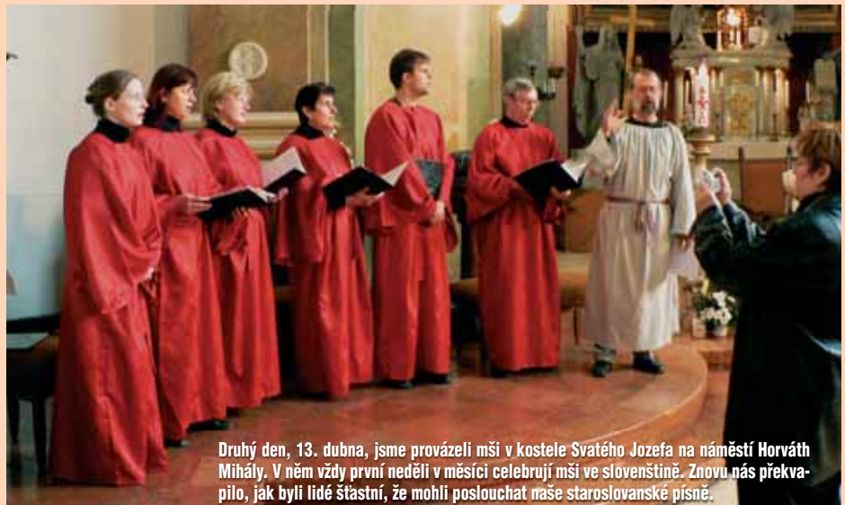
Druhý den, 13. dubna, jsme provázeli mši v kostele Svatého Jozefa na náměstí Horváth Mihály. V něm vždy první neděli v měsíci celebrují mši ve slovenštině. Znovu nás překvapilo, jak byli lidé šťastní, že mohli poslouchat naše staroslovenské písně.