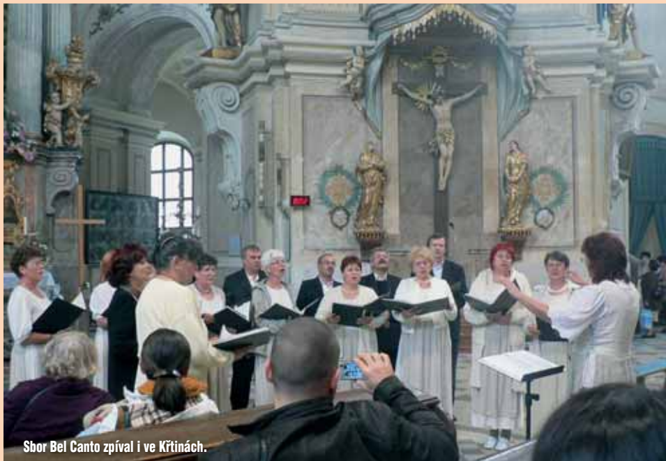
Sbor Bel Canto zpíval i ve Křtinách.