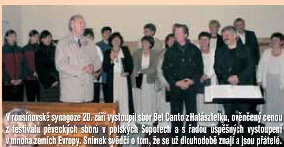
V rousínovské synagoze 20. září vystoupil sbor Bel Canto z Halászteleku, ověnčený cenou z festivalu pěveckých sborů v polských Sopotech a s řadou úspěšných vystoupení v mnoha zemích Evropy. Snímek svědčí o tom, že se už dlouhodobě znají a jsou přátelé.