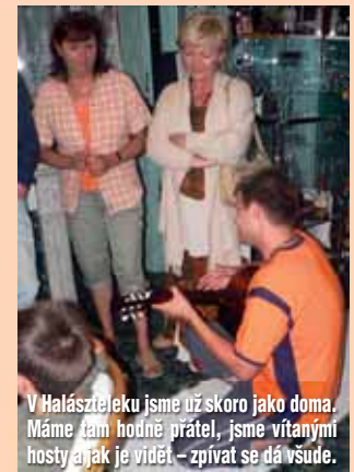
V Halászteleku jsme už skoro jako doma. Máme tam hodně přátel, jsme vítanými hosty a jak je vidět – zpívat se dá všude.