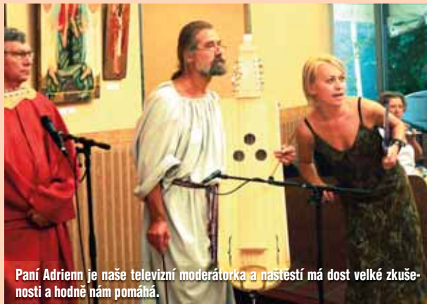
Paní Adrienn je naše televizní moderátorka a našťastí má dost velké zkušenosti a hodně nám pomáhá.