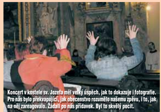
Koncert v kostele sv. Jozefa měl velký úspěch, jak to dokazuje i fotografie. Pro nás bylo překvapující, jak obecenstvo rozumělo našemu zpěvu, i to, jak na něj zareagovalo. Žádali po nás přidavek. Byl to skvělý pocit.