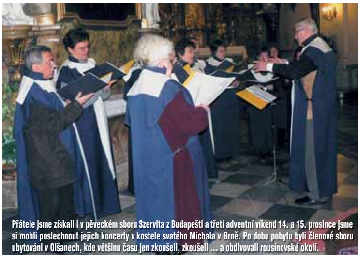
Přátele jsme získali i v pěveckém sboru Szervita z Budapešti a třetí adventní víkend 14. a 15. prosince jsme si mohli poslechnout jejich koncerty v kostele svatého Michala v Brně. Po dobu pobytu byli členové sboru ubytováni v Olšanech, kde většinu času jen zkoušeli, zkoušeli... a obdivovali rousínovské okolí.