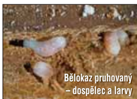
Bělokaz pruhovaný – dospělec a larvy

Proces soužití bělokazů s houbou má celou řadu biologických zvláštností během vývojových cyklů těchto broučků. Samička po oplození začne hledat matečnou chodbičku a na její stěny po obou stranách klade vajíčka a ke každému přidá po spore houby. Spolu s larvičkou se rozrůstá již v larvové chodbičce její podhoubí, kterým se larvička vydatně přživuje. Vývoj houby však nekončí se zakuklením larvy, ale rozrůstá se dál i do podélných cév (tracheí), které ucpává. Tím je